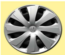
14" kotači XAUREL Active