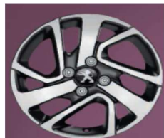
15" kotači THORREN Allure